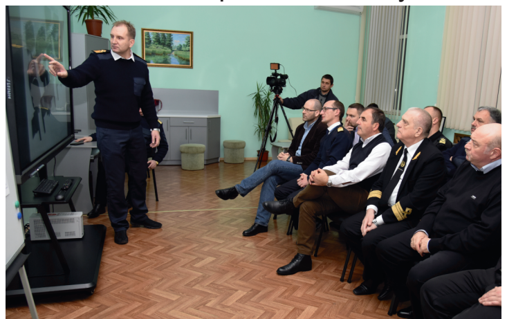
Презентація лабораторії для викладачів із навчання методики запровадження інноваційних технологій у фахову підготовку моряків

Інтенсивне зростання темпів науково-технічного прогресу, коли знання превалюють над капіталом, надає особливої цінності новаторській праці колективу та його керівнику, що підтримує невпинний розвиток і конкурентоспроможність Херсонської державної морської академії.