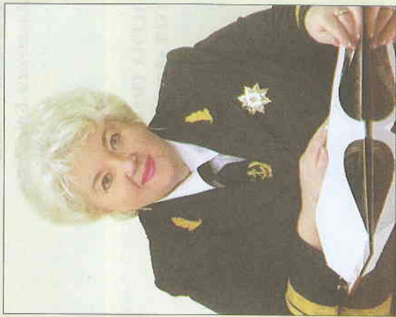
Автор статьи: Куликова Л. Б., Первый проректор, д.п.н., профессор Херсонской государственной морской академии

3 - Тригон – морское божество, дует в раковину.