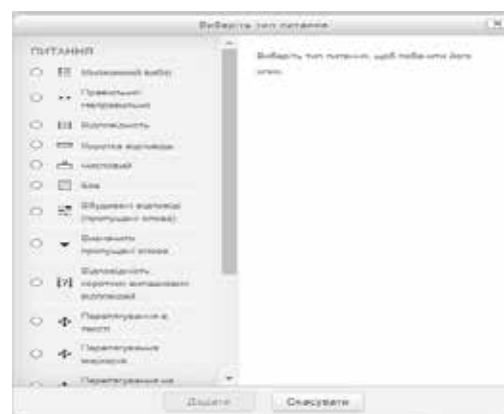
Рис. 1. Вікно вибору типу тестового питання

За В.С. Аванесовим можна виділити наступні принципи відбору змісту тесту: значущість (показники засвоєння матеріалу), наукова достовірність, системність змісту, стислість викладу, відсутність підказки та помилок, інформаційність, відповідність навчальній програмі. Діагностичний тест повинен бути надійним, валідним. Тестове завдання стандартно складається з інструкції, зразка виконання, тексту завдання (питання), правильної відповіді (еталон) [3, с. 100].