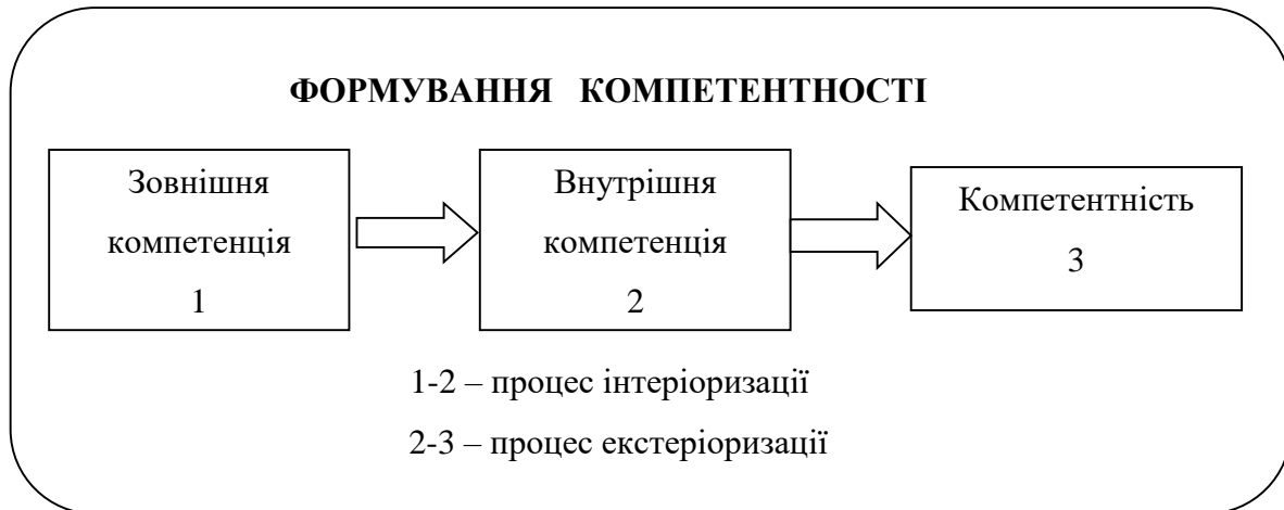
Рис. 1. Схема формування компетентності

Діяльність викладача з формування компетентності фахівця, зокрема майбутнього фахівця транспортної галузі, можна зобразити у вигляді такої схеми (рис. 1) [там само].