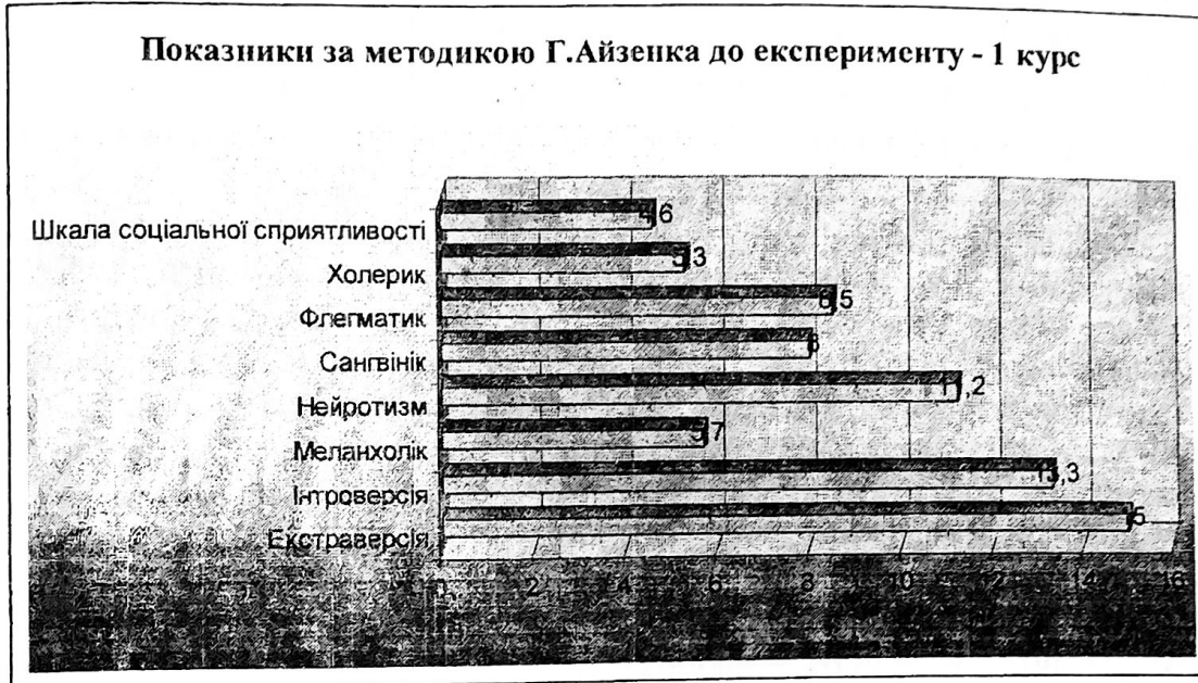
Рис. 1. Показники за методикою Г. Айзенка до проведення формувального експерименту

За нормами шкали соціальної несприятливості 4 бали в досліджуваних дещо завищені показники. Так, показник 4,6 балів пояснюється специфікою їх поведінки – певною демонстративністю й орієнтованістю на соціальне схвалення в очах однокурсників і професорсько-викладацького складу. Вони прагнуть бути кращими, що є ознакою потреби в особистісному зростанні. Графічно порівняльні показники наведено на рис. 1.