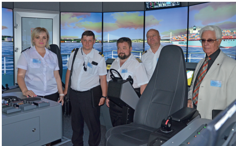
Тренажер повнофункціонального навігаційного містка з DP