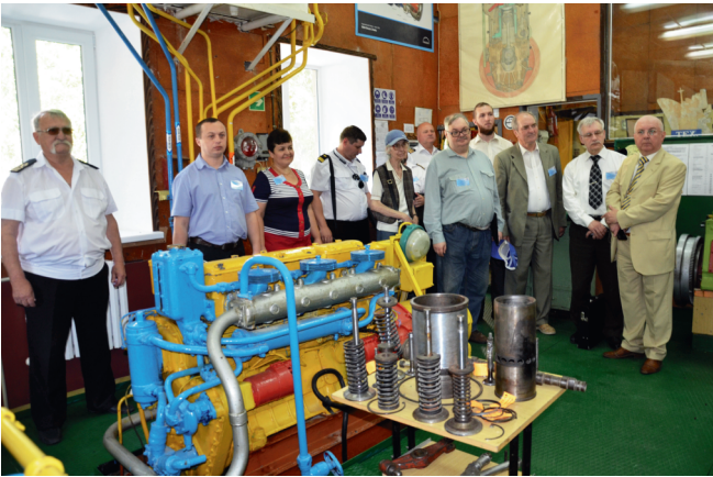
Гості оглядають машинне відділення