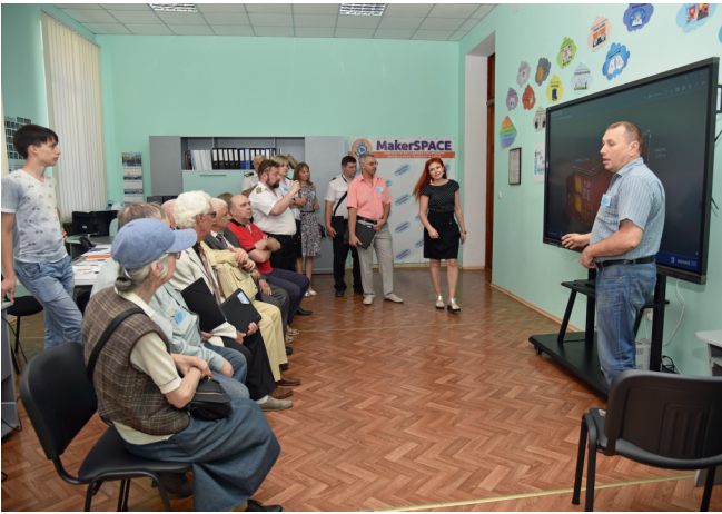
Учасники конференції у лабораторії інноваційних технологій навчання