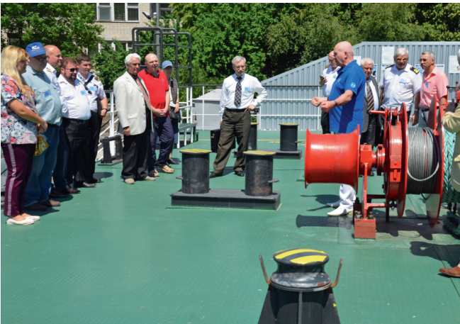
Учасники конференції на палубі судна (лабораторія «Швартовна станція»)