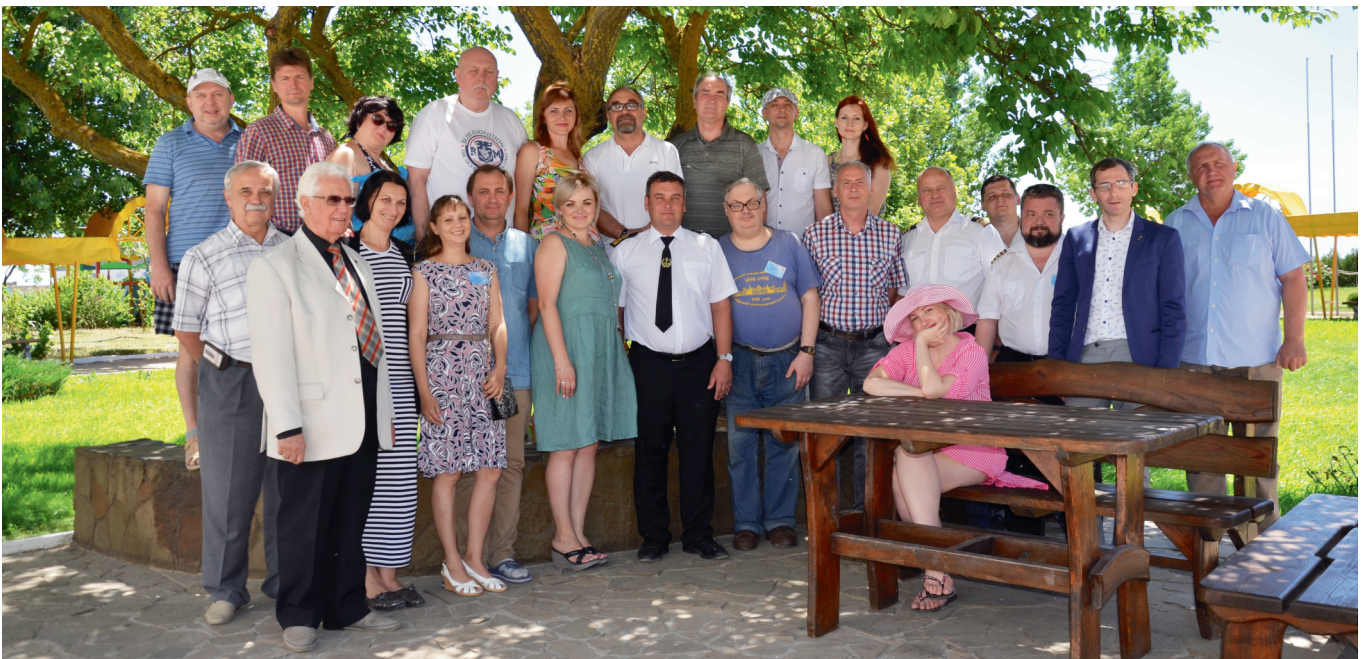
Учасники X Міжнародної науково-практичної конференції «Сучасні інформаційні та інноваційні технології на транспорті (MINTT – 2018)»