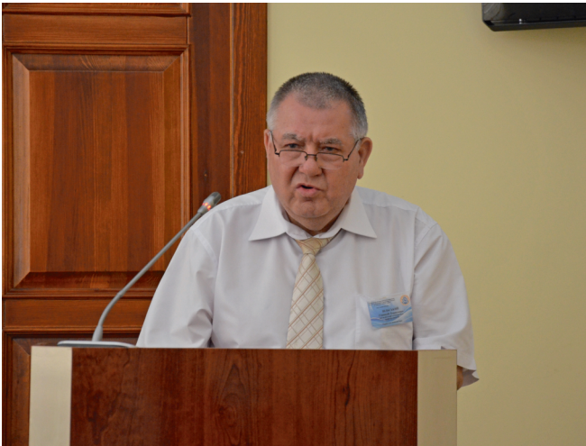
Виступ к.т.н., професора, академіка УАН Вільського Геннадія Борисовича